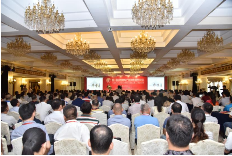
图 9 第三届海南橡胶产业发展（国际）论坛现场

坛由中国天然橡胶协会、上海期货交易所、中化国际(控股)股份有限公司和海南天然橡胶产业集团股份有限公司共同主办。