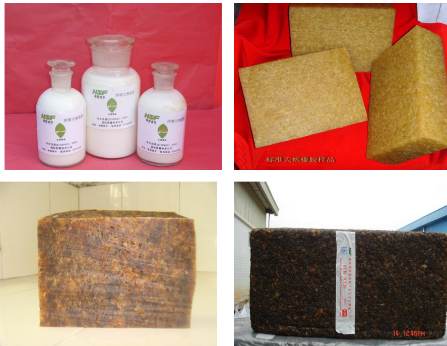
图 3 天然橡胶初加工产品