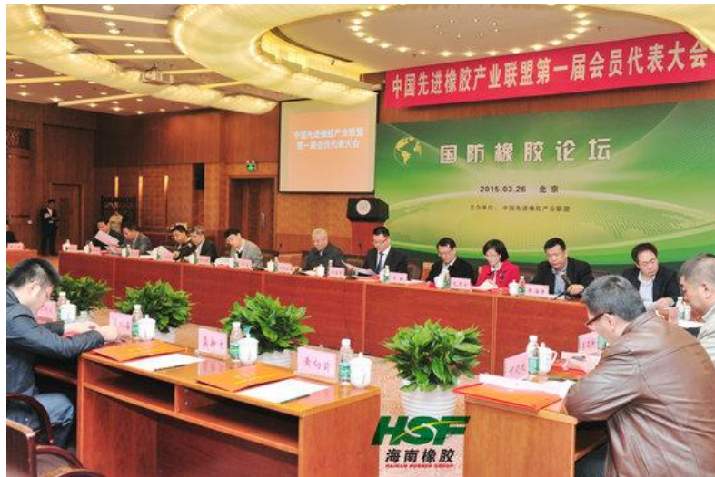
图 7 中国先进橡胶产业联盟第一届会员代表大会暨国防橡胶论坛召开现场

2015 年 7 月 8 日，空军有关部门在桂林主持召开“航空轮胎用国产天然橡胶替代应用研究技术鉴定”评审会，由海胶集团和曙光橡胶工业设计研究院共同研发的、使用国产天然橡胶材料制造的军用航空轮胎，通过了军方装机评审。这标志着我国的军用航空轮胎材料全面实现了国产化，军用航空轮胎等高端用胶 100%完全依赖进口的局面已被打破。