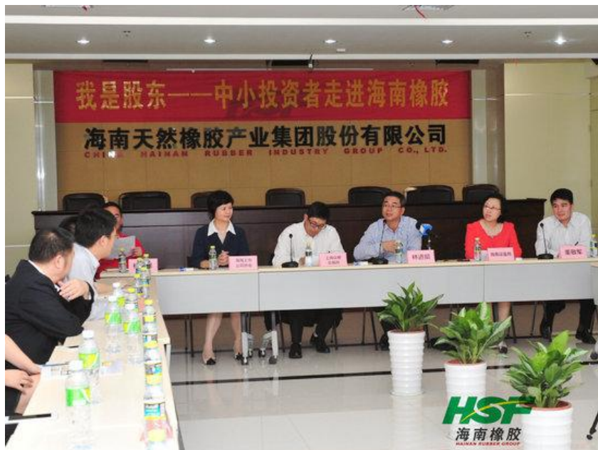
图 5 我是股东——中小投资者走进海南橡胶活动现场

自上市以来，公司一直高度重视维护投资者关系，通过创新工作方式、优化沟通渠道，加强投资者与公司的沟通交流，与投资者建立了良好的互动关系。公司通过接待机构以及个人投资者实地调研、举办业绩说明会、或借助证券机构投资策略会平台、电话会议等形式，主动开展公司推介和投资者交流活动，2015 年共接待 30 余家投资机构。