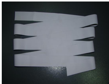
图 4 天然橡胶深加工产品-乳胶丝