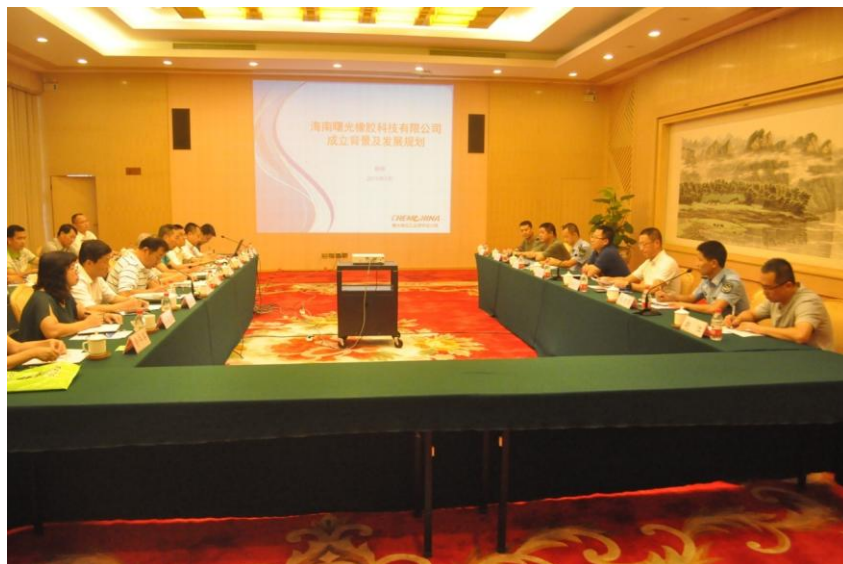
图 8 航空轮胎用国产天然橡胶替代应用研究技术鉴定评审会召开现场

2015 年 7 月 8 日，空军有关部门在桂林主持召开“航空轮胎用国产天然橡胶替代应用研究技术鉴定”评审会，由海胶集团和曙光橡胶工业设计研究院共同研发的、使用国产天然橡胶材料制造的军用航空轮胎，通过了军方装机评审。这标志着我国的军用航空轮胎材料全面实现了国产化，军用航空轮胎等高端用胶 100%完全依赖进口的局面已被打破。