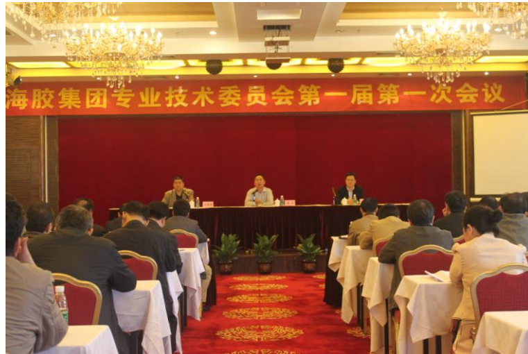
图 6 海胶集团专业技术委员会第一届第一次会议现场

2015 年取得成绩：（1）专利：一种胶清胶的加工方法（专利号：ZL201410045820.2）；（2）获奖：高弹减震天然橡胶开发获海口市科学技术进步一等奖。