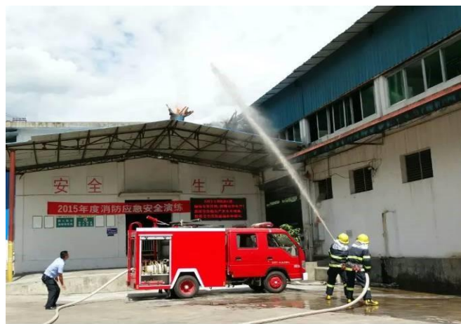
图 12 下属加工分公司开展消防演练活动

同时，公司还加强员工安全生产的培训，全年（含各分子公司自行开展的培训）共组织培训 351 次，1952 个学时，26956 人次参加。通过开展安全生产月、开展“打非治违”专项整治等活动，并加强对安全生产的现场督导，加强员工的安全生产意识，及时发现存在的安全隐患，预防生产安全事故的发生。为确保事故发生时临危不乱、应对有序，公司要求各下属单位定期开展消防和重大危险源泄漏的应急演练。