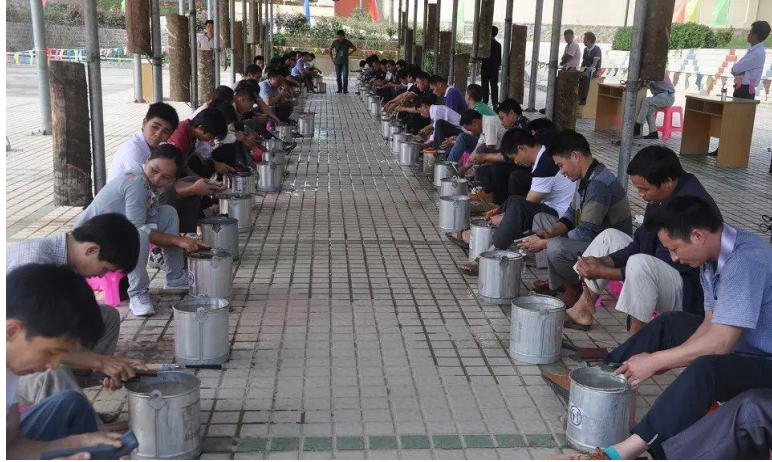
图 10 岗位练兵技能比武决赛现场

开展学习宣传“最美海胶人”活动。公司组织虞海浓、潘金吉、叶周玉等 9 名“最美海胶人”深入到 11 个基层单位作巡回宣讲；各基层单位以出版宣传专栏、张贴人物事迹、座谈会讨论、广播宣传等方式，组织本单位员工开展学习宣传“最美海胶人”精神事迹活动。同时邀请“最美海胶人”代表与本单位优秀员工一起深入到作业区、生产队开展巡回报告。累计开展巡回宣讲 600 多场次、召开学习交流会 700 多场次、张贴人物事迹宣传海报 3935 份，有 4.7 万名员工接受了教育活动。